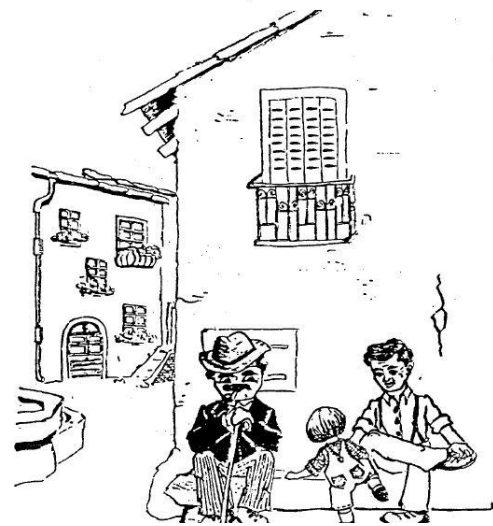
Dessin original des premiers numéros

Je vous souhaite une bonne lecture de ce nouveau Flash Oérin.