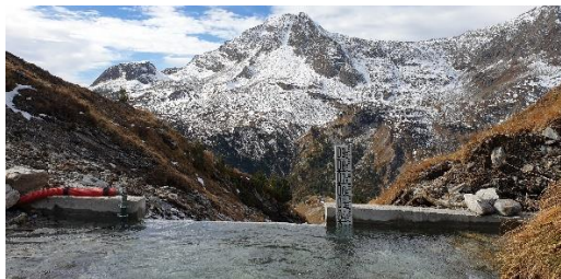
Construction du batardeau

Construction d'un batardeau en octobre : dans le lit du ruisseau de la Fournache pour connaître les différents débits à différentes périodes en vue du dimensionnement de la future microcentrale.