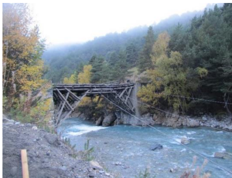
Démolition du Pont de la Scie