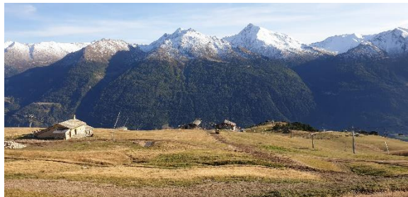
Enfouissement de la ligne HTA

Remplacements du tableau HTA au poste St Sébastien et celui des Fleurs (juin 2020).